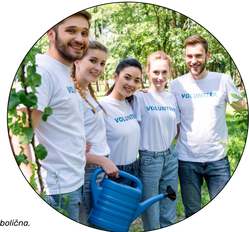
Slika je simbolična.

• • • • • Jaz sem v življenju našla svoj dar šele pri svojih petdesetih letih. Nikoli ni prepozno najti sebe, v sebi. Vse življenje se lahko učimo, se iščemo, želimo biti srečni, predvsem pa zdravi. Želim, da bi bila moja znanja še v nadalje finančno dostopna ljudem, zato bom s prostovoljnimi deli še nadaljevala. Saj kadar svoje delo opravljamo s srcem, delamo to kar nas veseli brez napora in z velikim učinkom, začutimo potrditev iz okolja in postajamo srečni. Vsi imamo ta skriti potencial v sebi le, da ne vemo zanj, ker ga niti ne iščemo, dokler nas življenje ne pahne v to iskanje. Ko posameznik najde ta zaklad v sebi, dela to, kar zna najbolje, za čemur sanjari in ga veseli. Če bi bilo več takšnih ljudi v našem okolju bi življenje postalo mirnejše, ljubeče in srečno - morda za koga utvara, zame ni. Zato zahvala vsem prostovoljcem, ki s svojim delom prispevajo k medsebojnemu povezovanju ljudi in lepšemu jutri.