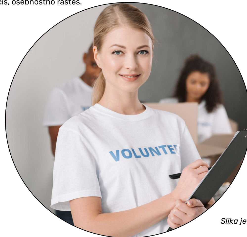
Slika je simbolična.

Pri prostovoljstvu mi je všeč občutek, da lahko nekemu pomagaš, da delaš nekaj dobrega, da se učiš, osebnostno rasteš.