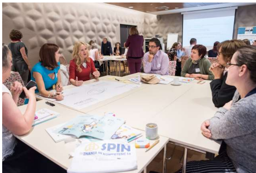
Zaključna konferenca SPIN

19. maja 2022 se je v sklopu skladove dvodnevne konference odvila tudi zaključna konferenca programa, v okviru katere je bila izvedena svetovna kavarna z naslovom »Zavrtimo se v prihodnost – priložnosti na področju krepitve kompetenc zaposlenih«. Udeleženci so se strinjali, da je potrebno zgodnje ozaveščanje o pomenu vseživljenjskega usposabljanja, da morajo podjetja prepoznati potrebe po usposabljanju svojih zaposlenih in koristi, ki jih bodo usposabljanja doprinesla, in da bi bilo v prihodnje smiselno za tovrstne programe nameniti več finančnih sredstev, saj je potrebna večja fleksibilnost pri določitvi ur usposabljanj na zaposlenega, smiselno je krajši terminski plan poteka programa, a hkrati kontinuiran potek, ki traja iz ene perspektive v drugo neprekinjeno.