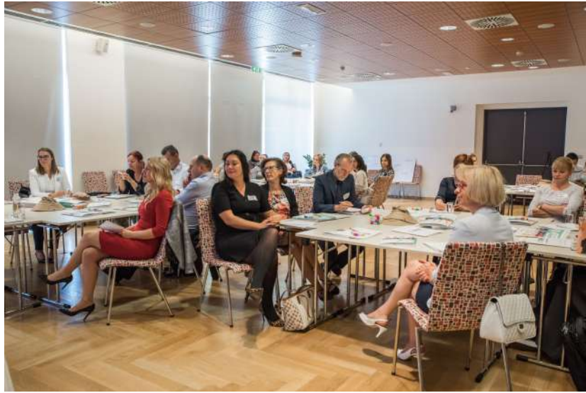
Zaključna konferenca SPIN

Projektni partnerstvi sta informirali o projektu potencialne udeležence in različna podjetja, izvedli sta promocijo projekta na spletnih straneh in družbenih omrežjih, predstavili dosežke na novinarski in zaključni konferenci, pripravili primere dobrih praks in zadovoljstva udeležencev, objavili članke o projektu, izvedli radijsko kampanjo in izdelali raznovrsten promocijski material.